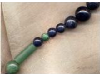
Blauquarz – Riesenauswahl an Schmuck