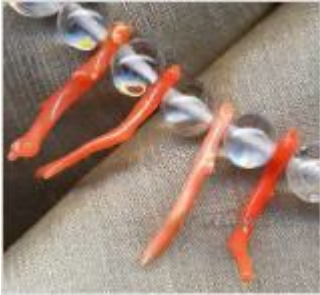
Bergkristall – Riesenauswahl an Schmuck

→ Orange Aventurin → Brauner Aventurin → Grüner Aventurin