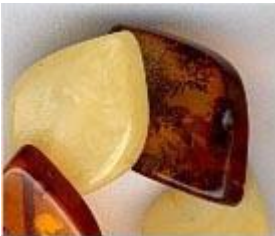
Bernstein – Riesenauswahl an Schmuck

Bergkristall, Edelstein der Klarheit und Erleuchtung Quarz allgemein